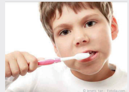
Bei der Prophylaxe lernen Ihre Kinder die richtige Zahnpflege.

Es gibt also keinen Grund, warum Sie auf Prophylaxe für Ihre Kinder verzichten sollten.