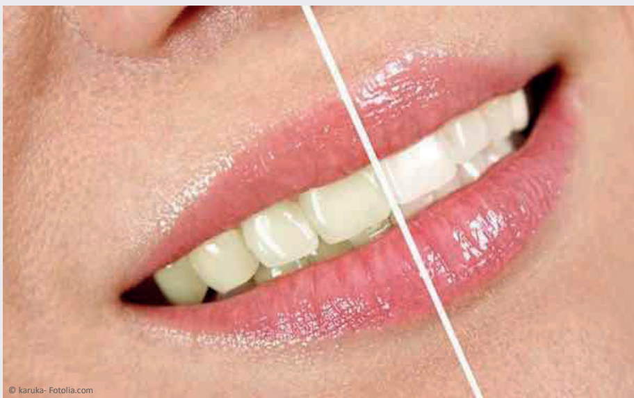
Deutlicher Unterschied: Professionelles Bleaching beim Zahnarzt wirkt!

Vertrauen Sie Ihre Zähne besser Profis an!