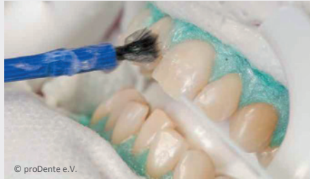
Power-Bleaching beim Zahnarzt: Auftragen des Bleaching-Gels

Wenn Sie die Praxis wieder verlassen, können Sie sich an sichtbar helleren Zähnen freuen!