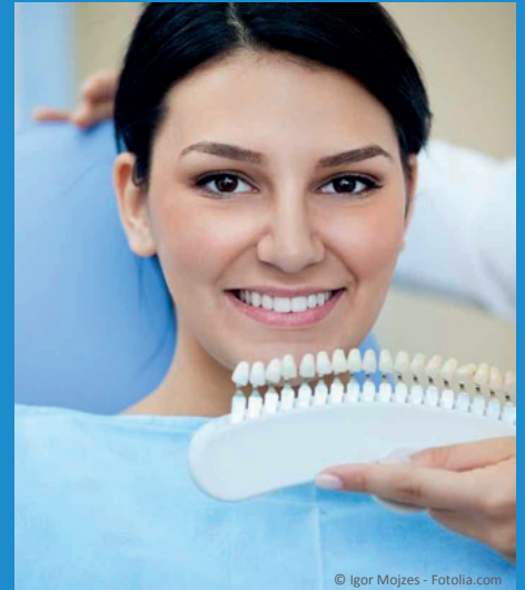
Bleaching vom Zahnarzt: Gewinnendes Lächeln mit strahlend weißen Zähnen

Dunkle Zähne können ein ziemliches Ärgernis sein: Obwohl sie sauber geputzt sind, wirken sie einfach nicht hell. Die Folge ist: Man traut sich oft nicht mehr, unbefangen zu reden und zu lächeln. Man achtet darauf, dass andere die Zähne nicht sehen. Und wenn man fotografiert wird, lässt man den Mund lieber zu. Das muss nicht sein: Zähne können heute mit bewährten Methoden wieder aufgehellt werden. Professionelles Bleaching beim Zahnarzt kostet nur wenige Hundert Euro. Aber das neue Lebensgefühl ist unbezahlbar!