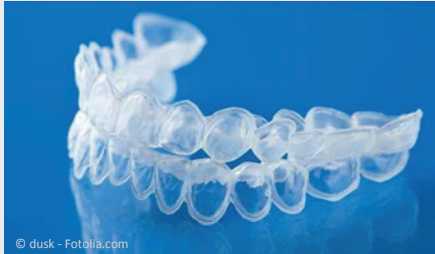
Bleaching-Form aus Kunststoff, in die Sie das Aufhellungs-Gel einfüllen.

Beim Home-Bleaching werden vom Zahnarzt dünne flexible Formen aus einem transparenten Kunststoff hergestellt, die genau auf Ihre Zähne passen (siehe Foto).